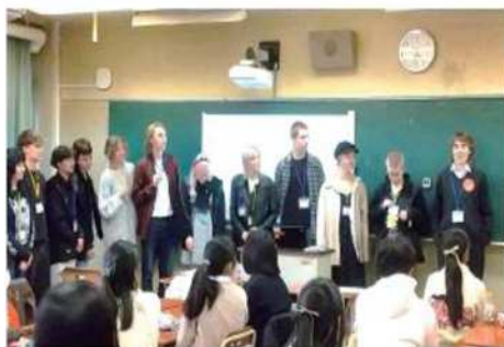
都立高校での授業参加体験・グループディスカッション