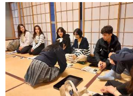
日本文化体験（弓道・茶道）